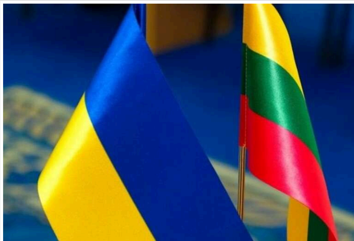
Литва надала Україні новий пакет військової допомоги

У Міністерстві оборони Литви повідомили про чергову партію допомоги, доставлену Україні цього тижня.