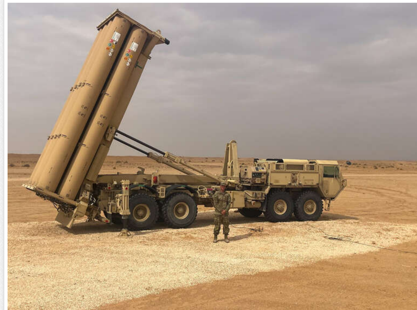
США, скоріш за все, не нададуть Україні ЗРК THAAD, який здатний збивати російські балістичні ракети типу "Орешник"