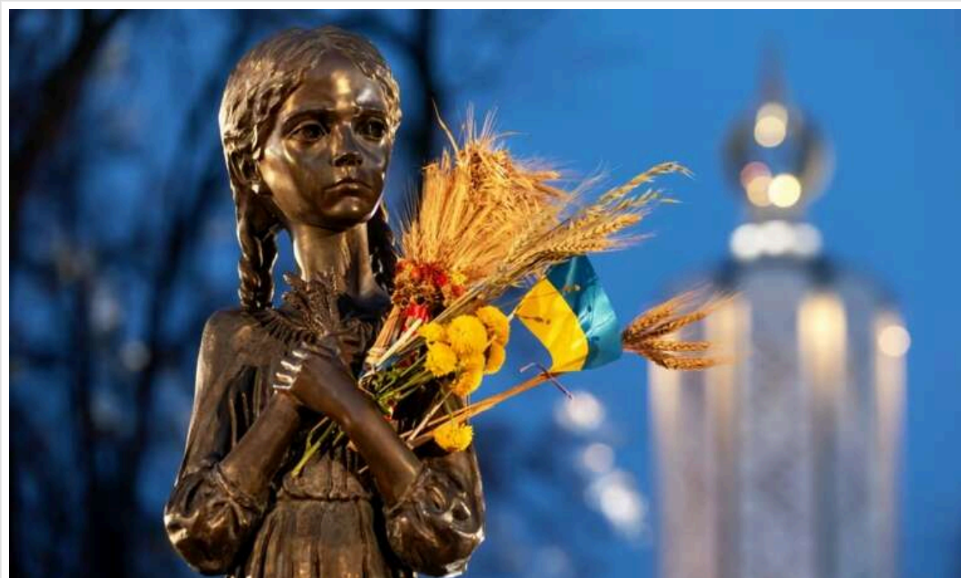
Світ має знати про Голодомор, щоб зрозуміти мотиви нинішньої агресії РФ, - Сибіга

Світова спільнота повинна не лише зберігати пам'ять про Голодомор в Україні. Вона також повинна розуміти, чому комуністичний режим вдалося до геноциду українського народу. Тільки так можна збагнути справжні мотиви війни, яку Росія зараз веде проти України.