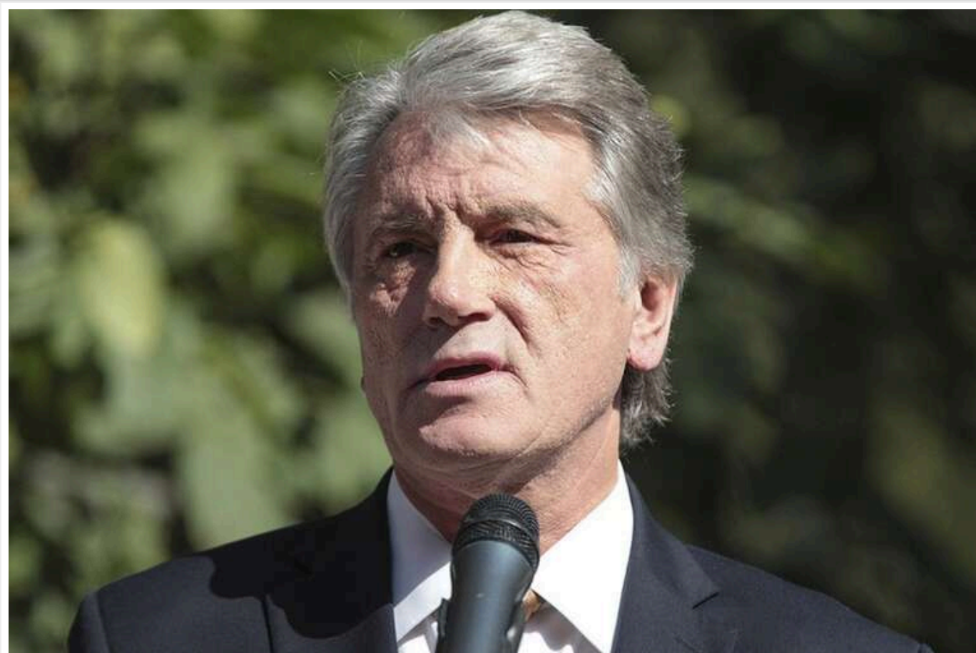
Розвідка США: За отруєнням Ющенка, ймовірно, стоїть Росія

Сполучені Штати розсекретили документ про вбивства за кордоном політичних опонентів російського диктатора Володимира Путіна.