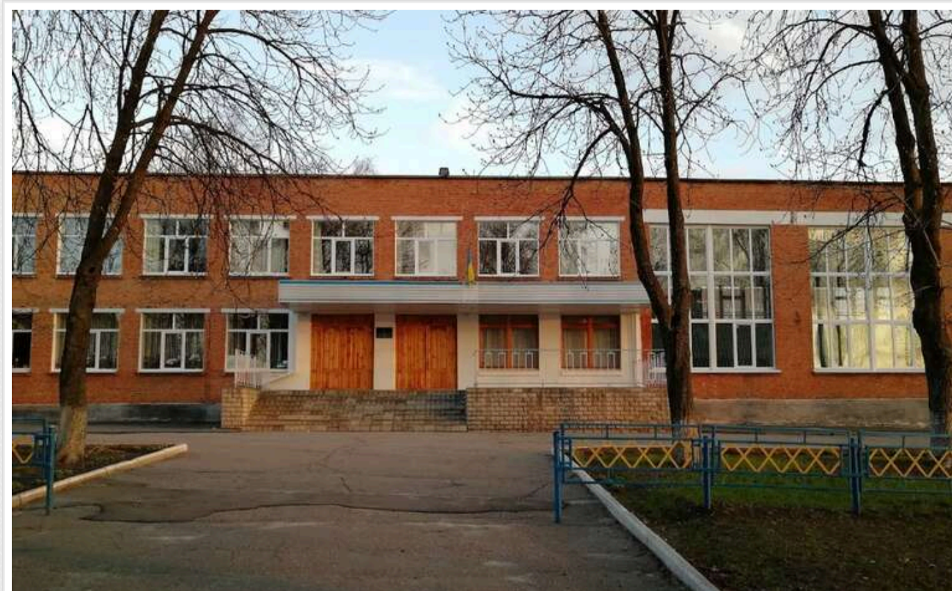
У Сумах витратять 7 мільйонів на ремонт харчоблоку в школі за завищеними цінами на обладнання та з підрядником зі сумнівною репутацією

Школа №27 у Сумах 29 жовтня за результатами тендеру замовила ПП «Гольфстрім» ремонт харчоблоку, обідньої зали та підсобних приміщень (коригування) за 7,33 млн грн.