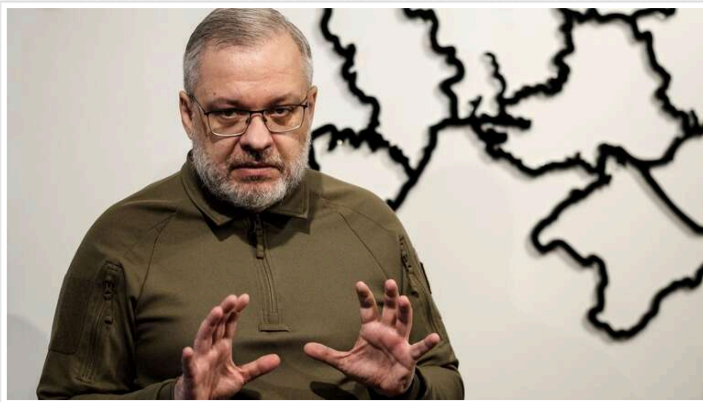
Галущенко: Ситуація на ЗАЕС стає небезпечнішою через часті перебої в електропостачанні

Ситуація на Запорізькій атомній станції стає дедалі ризикованішою через часті перебої в зовнішньому електропостачанні.