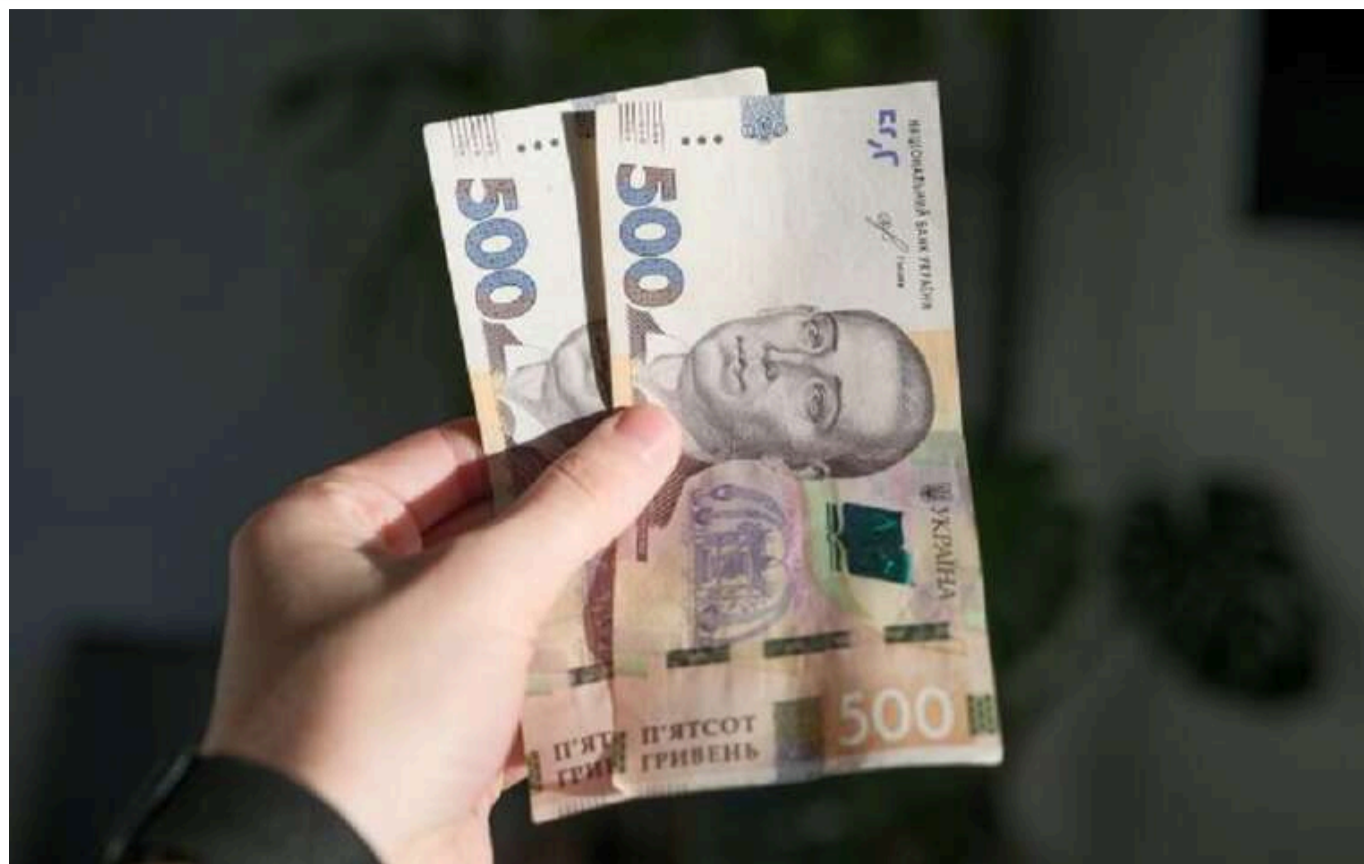
На «тисячу Зеленського» цьогоріч витратять 5 мільярдів гривень: наступного року – вдвічі більше

На так звану «тисячу Зеленського» для всіх українців цього року витратять 5 мільярдів гривень. У 2025 році на програму заплановано виділити 10 мільярдів гривень.