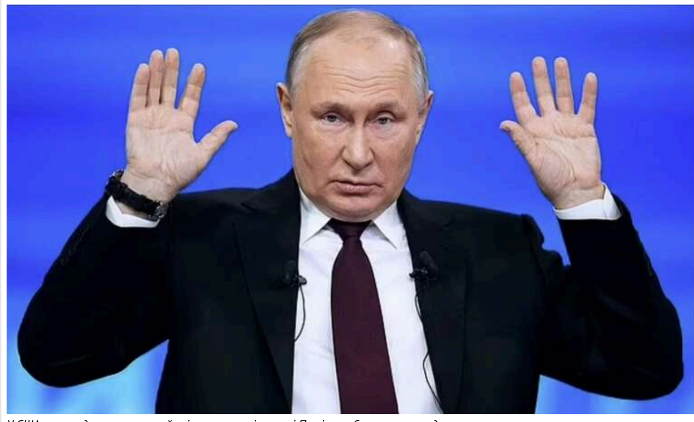
У США оприлюднили секретний звіт про санкціоновані Путіним вбивства за кордоном

Американська розвідка повідомила про санкціоновані Путіним вбивства за межами Росії.