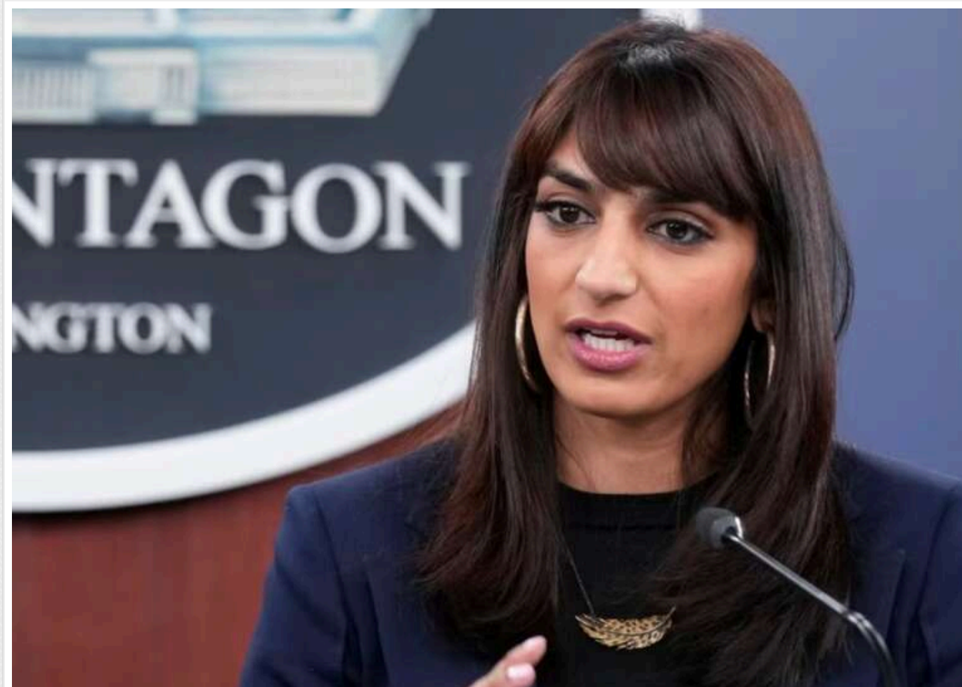
США отримали попередження від Росії про удар "Орешніка" через канали ядерної безпеки

Міністерство оборони США підтвердило, що Штати отримали попередження від Росії про удар "Орешніка" по лініях ядерної безпеки.