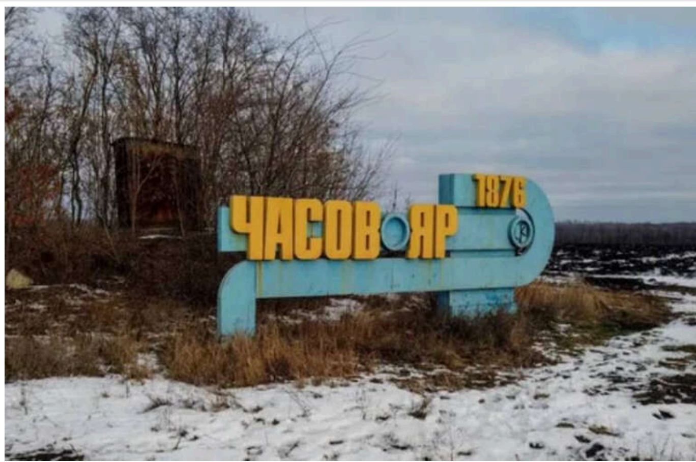
У ЗСУ розповіли, чи просунулись війська РФ до центру Часового Яру

Тактика РФ "розвідка м'ясом" і "штучне просування" стала причиною появи повідомлень про рух окупантів до центру Часового Яру.