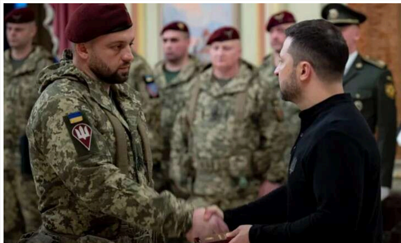
Зеленський привітав Десантно-штурмові війська України з їхнім професійним святом

У День десантно-штурмових військ України президент Володимир Зеленський провів зустріч з військовими ДШВ ЗСУ. Глава держави не лише привітав українських захисників, але й вручив державні нагороди.