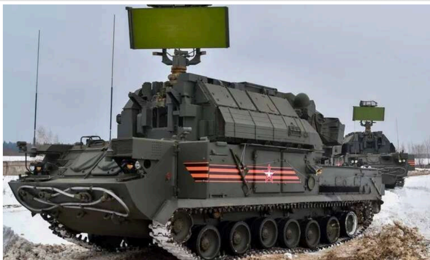
Білорусь отримала від Росії комплекси "Тор-М2"

Російська Федерація відправила в Білорусь зенітно-ракетні установки "Тор-М2", які, за їхніми словами, будуть захищати Мінськ.