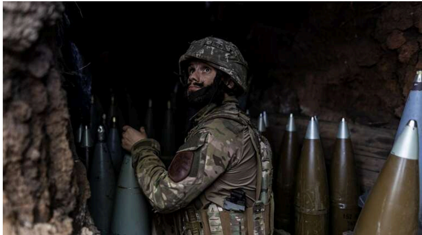
Ситуація на фронті: росіяни тиснуть на Покровському та Курахівському напрямках

З самого ранку 21 листопада на передовій сталося 174 зіткнення. Найбільший тиск з боку росіян був спрямований на Сили оборони на Покровському та Курахівському напрямках у Донецькій області.