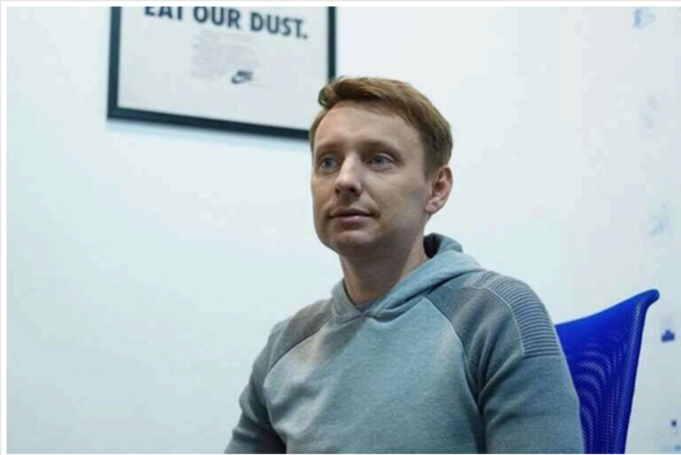
Втеча через "Шлях": журналісти звернулись до ДПСУ, щоб встановити перебування екскрегіонала Кацуби

Цієї весни вітчизняні ЗМІ, посилаючись на Державну прикордонну службу, опублікували інформацію про те, що колишній народний депутат Олександр Кацуба після початку вторгнення Росії виїхав до Польщі через систему "Шлях" і не повернувся в Україну.