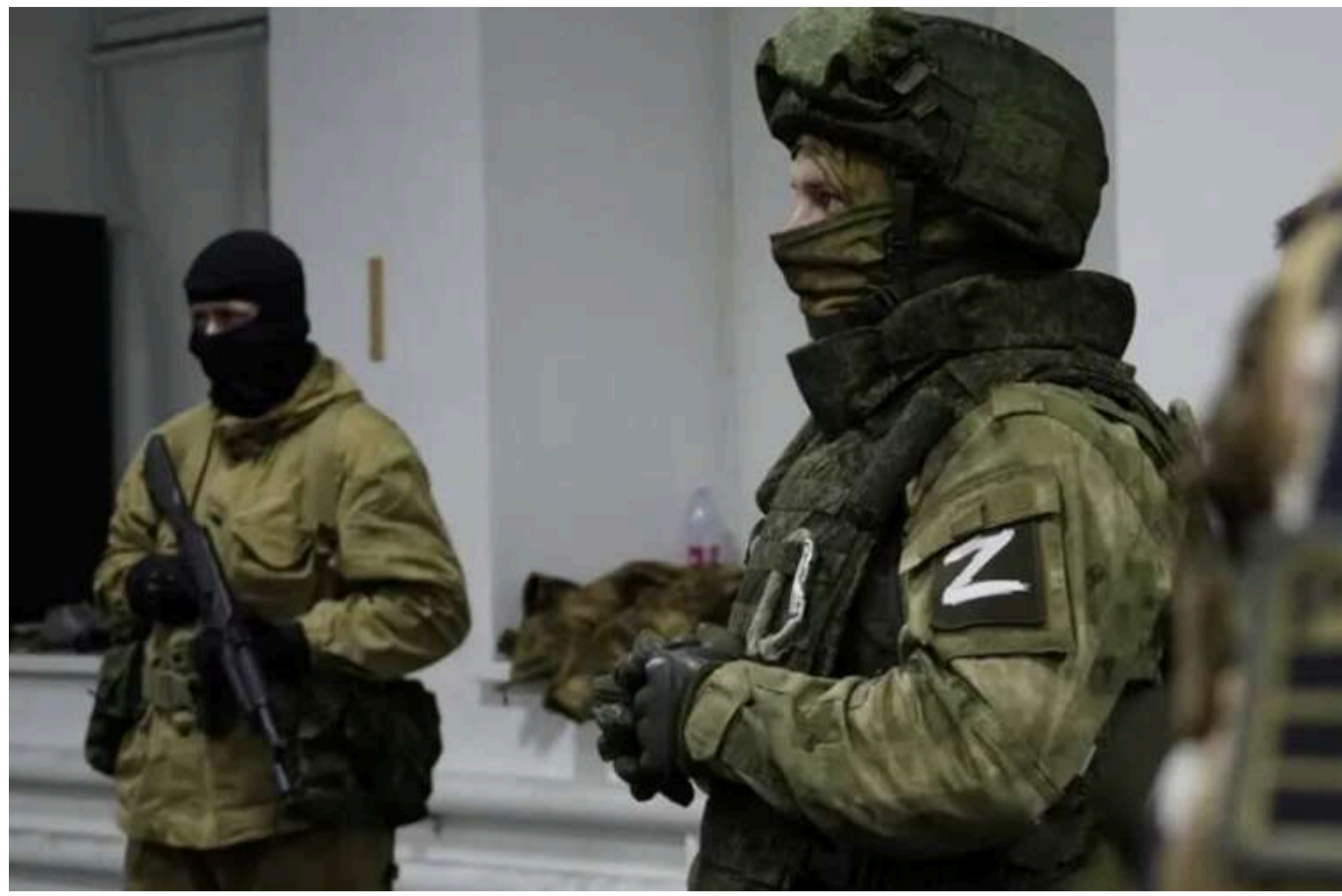
Розстріл українських військовополонених: омбудсмен звернувся до ООН

У середу, 20 листопада, стало відомо про новий воєнний злочин російських окупантів. Військові РФ знову розстріляли українських полонених на Курщині.