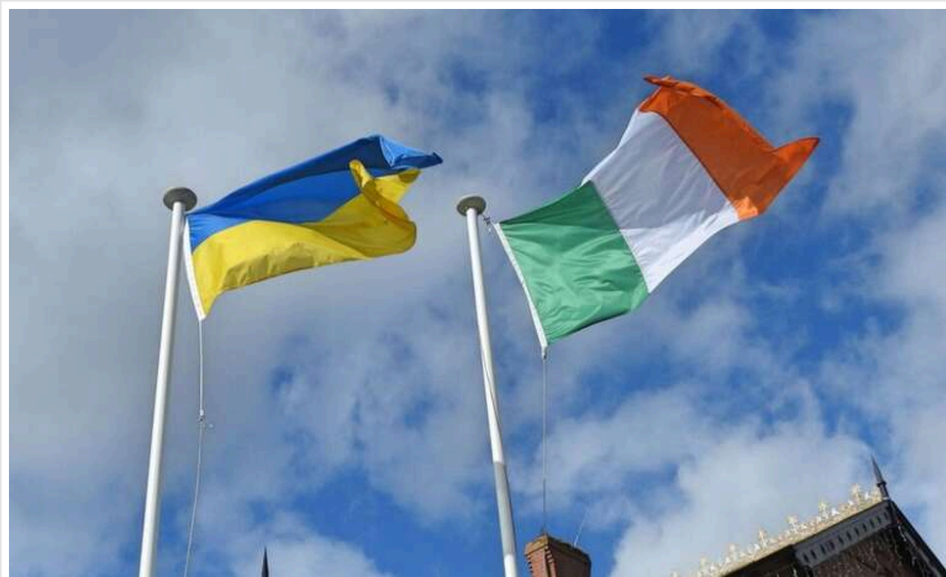
Співробітникам посольства Ірландії в Україні дали вказівку працювати дистанційно

Співробітникам посольства Ірландії в Україні наказано працювати віддалено через зростання військової напруженості в країні.