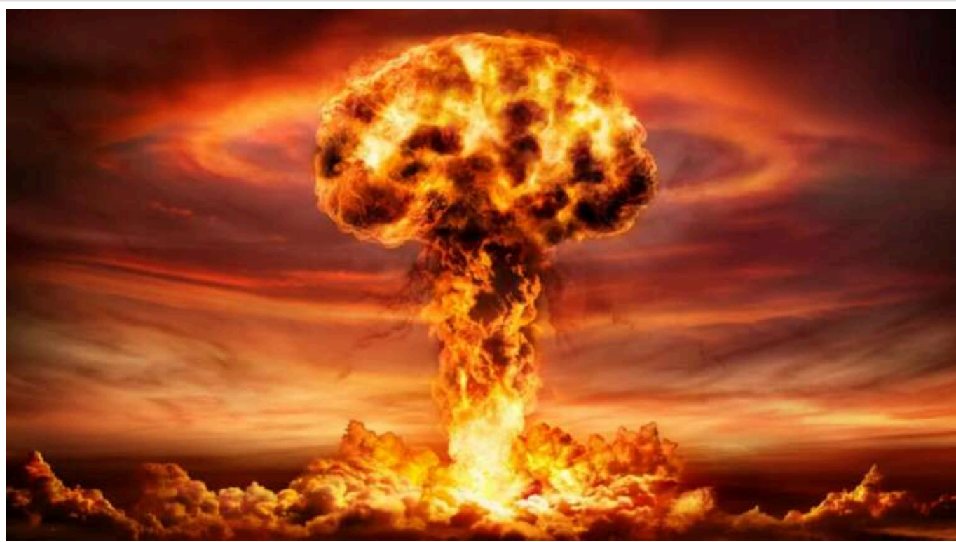
Російські удари 17 листопада загрожували ядерною катастрофою в Європі, – The Guardian

Атаки Москви були спрямовані на електростанції, що забезпечують роботу трьох українських АЕС, які виробляють близько 60% електроенергії країни.