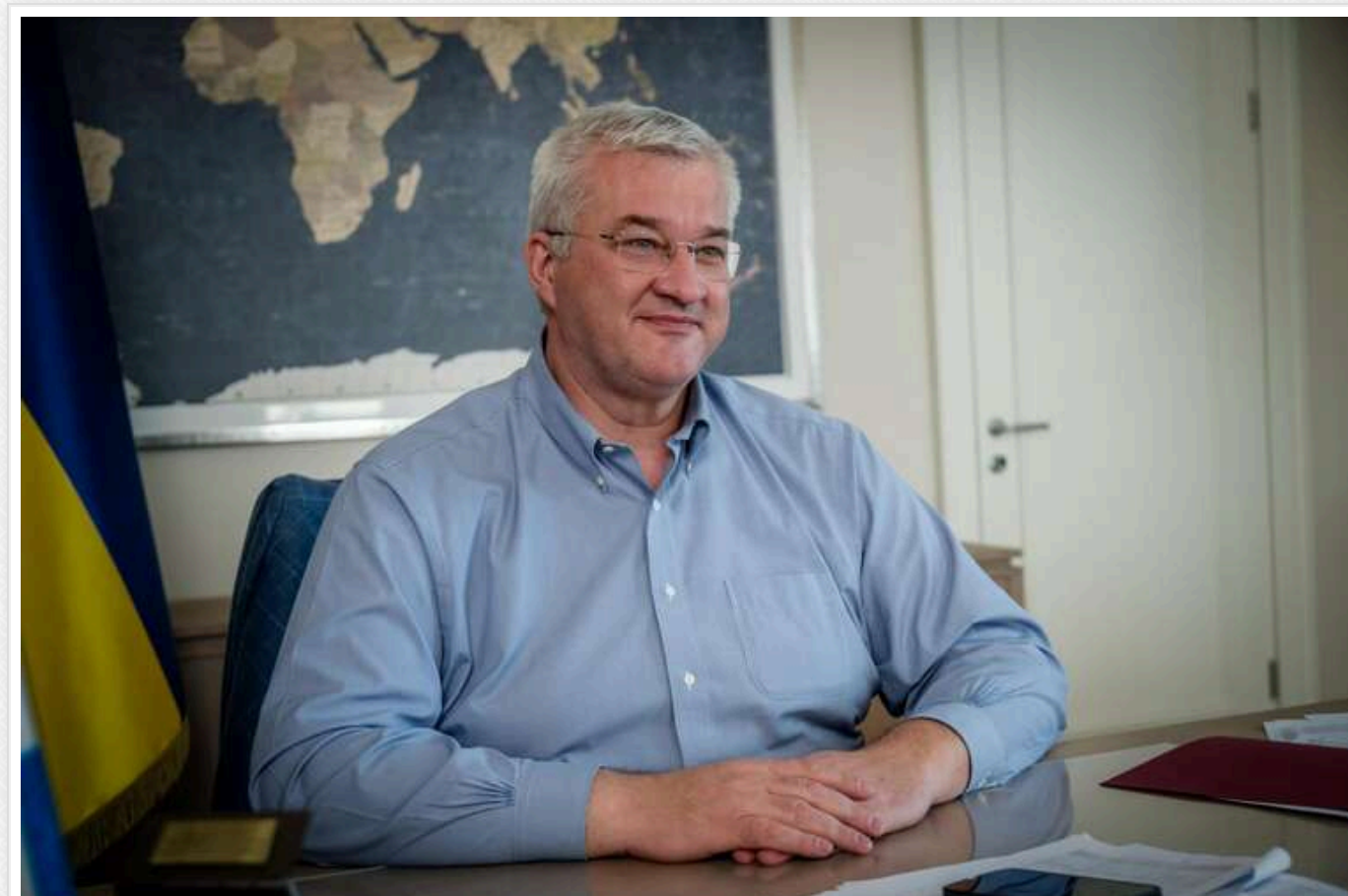
Україна не прийме жодних мирних пропозицій, які передбачають компроміс щодо територій і суверенітету, — Сибіга