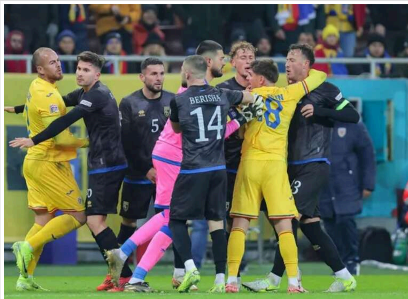
УЄФА оголосив рішення щодо скандального матчу Ліги націй

Футбольний союз європейських асоціацій (УЄФА) призначив технічну поразку 0:3 збірній Косова в матчі проти Румунії.