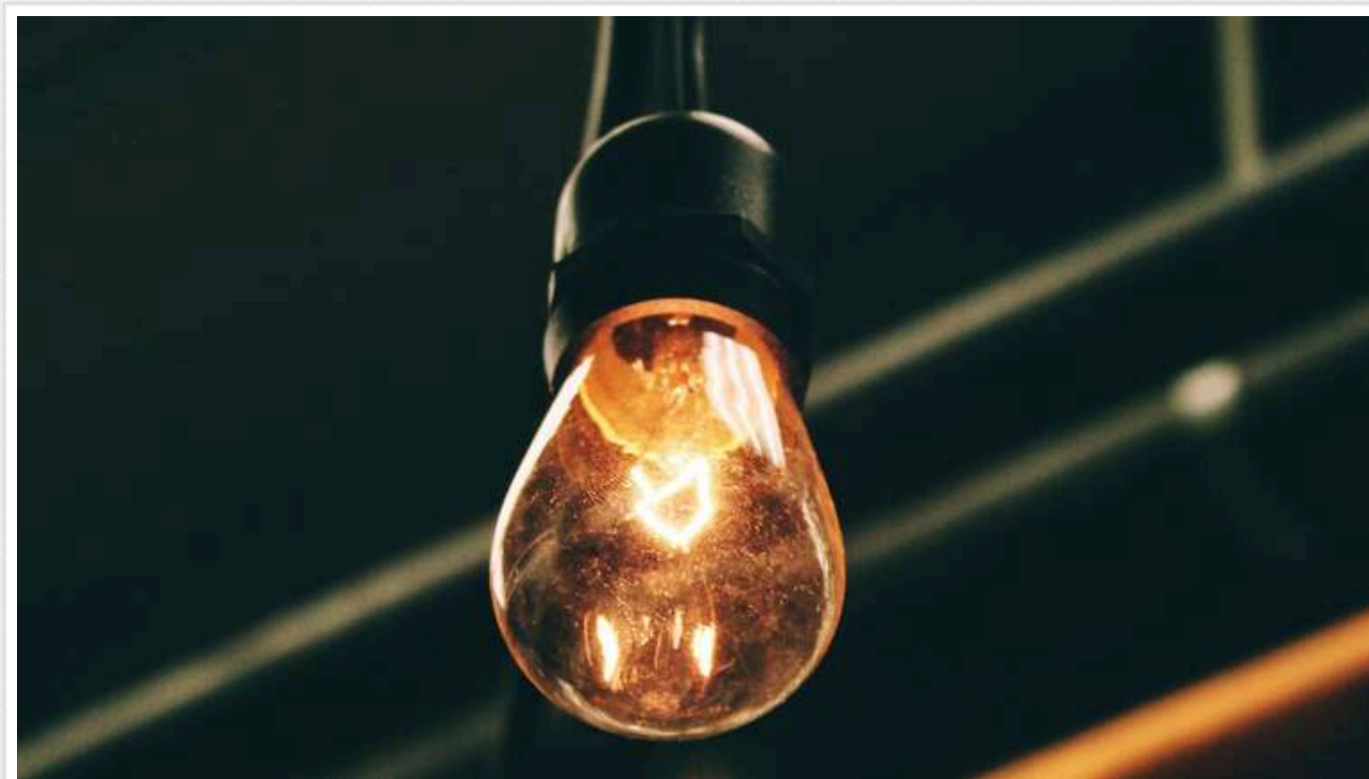
"Укренерго" оприлюднило графіки відключень світла на завтра

"Укренерго" публікує інформацію щодо відключень світла в четвер, 21 листопада.