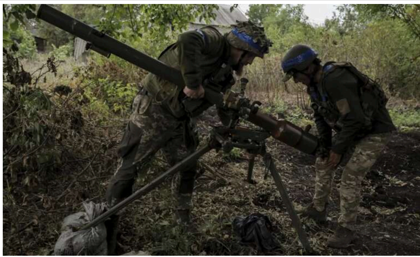
ЗСУ відчувають серйозну нестачу ресурсів і досвідчених командирів, - NYT