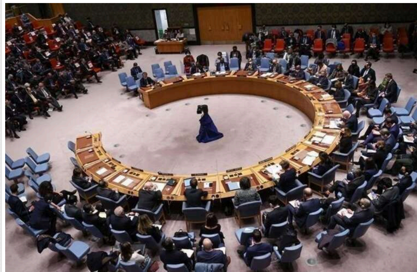
США наклали вето на проєкт резолюції Радбеза ООН, в якій міститься заклик до припинення вогню в Секторі Гази та звільнення заручників

Вчетверте США наклали вето на проєкт резолюції Ради Безпеки ООН, який вимагає негайного припинення вогню в Газі, звільнення ув'язнених і запобігання голодній смерті.