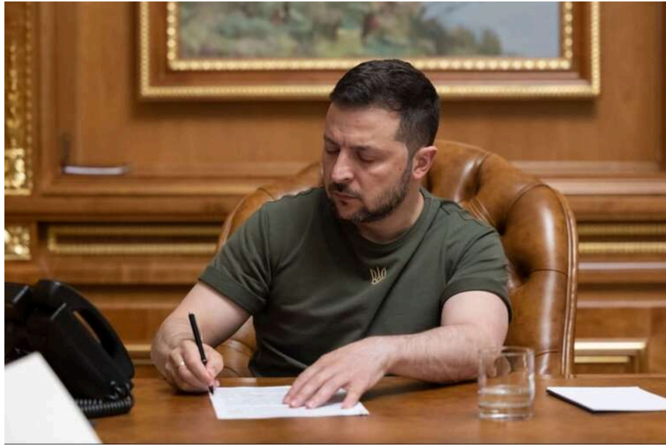
Зеленський підписав закон про позбавлення державних нагород зрадників України

Парламент прийняв законопроект про позбавлення державних нагород зрадників України. Український президент Володимир Зеленський його вже підписав.