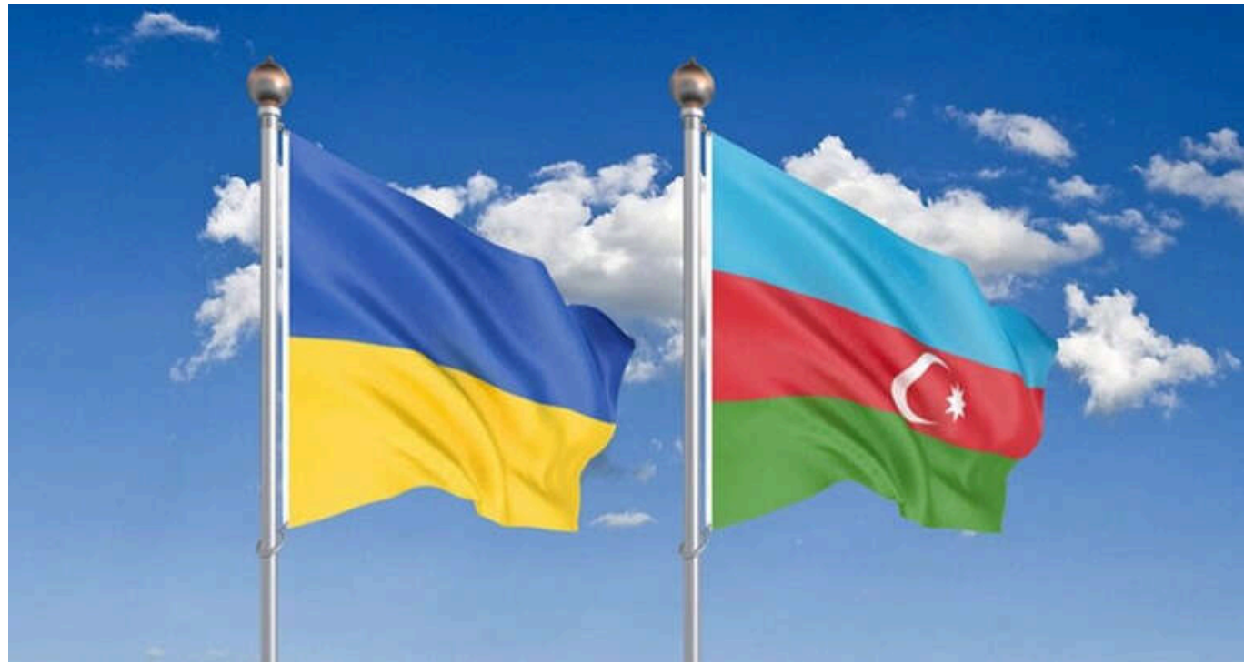
Посольства Киргизстану та Азербайджану також звернулися до своїх громадян із проханням залишити Україну

Посольства деяких іноземних держав порадили своїм громадянам залишити Україну.