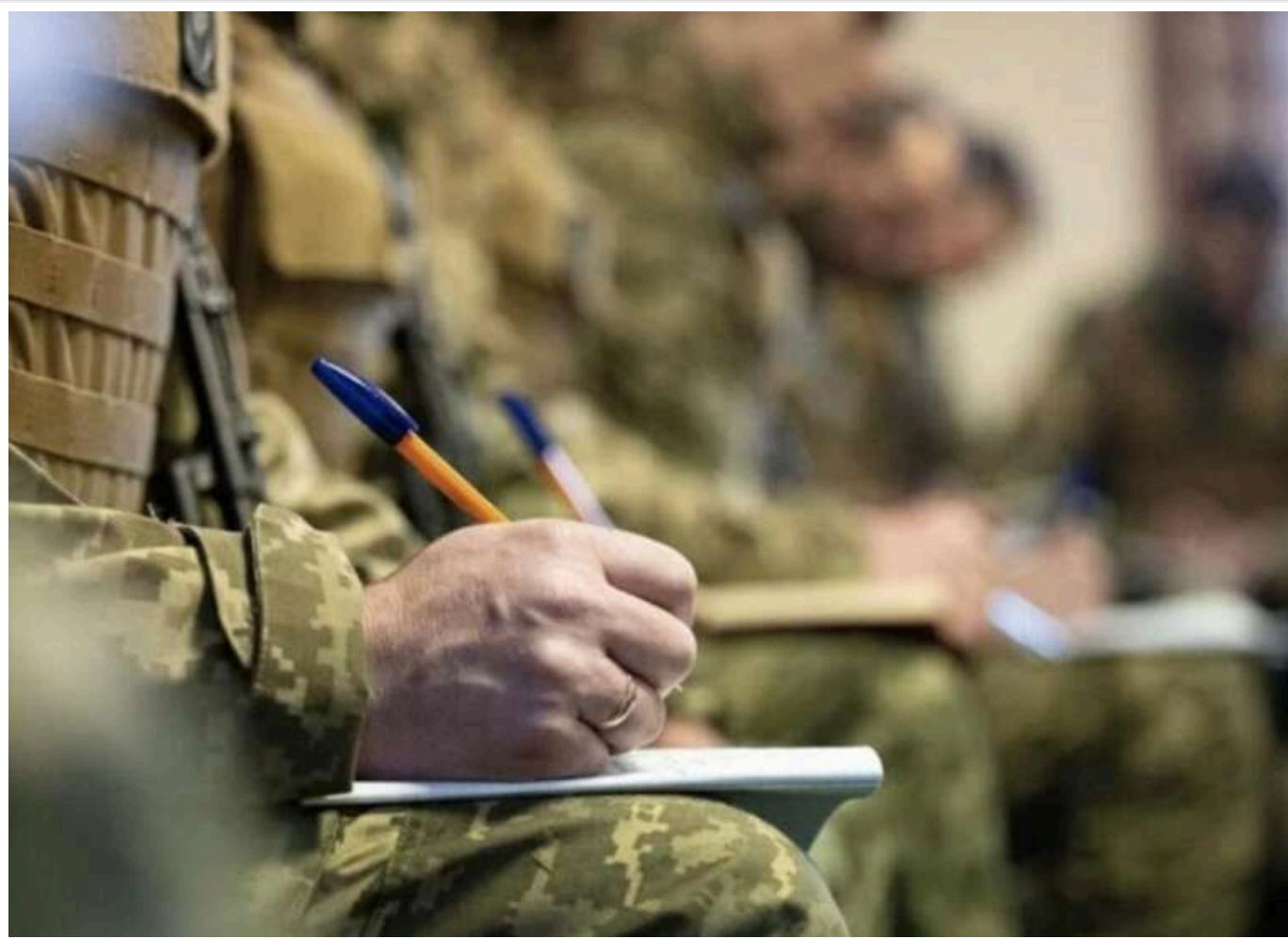
Ті, кого мобілізували примусово, зможуть звернутися до військового омбудсмена