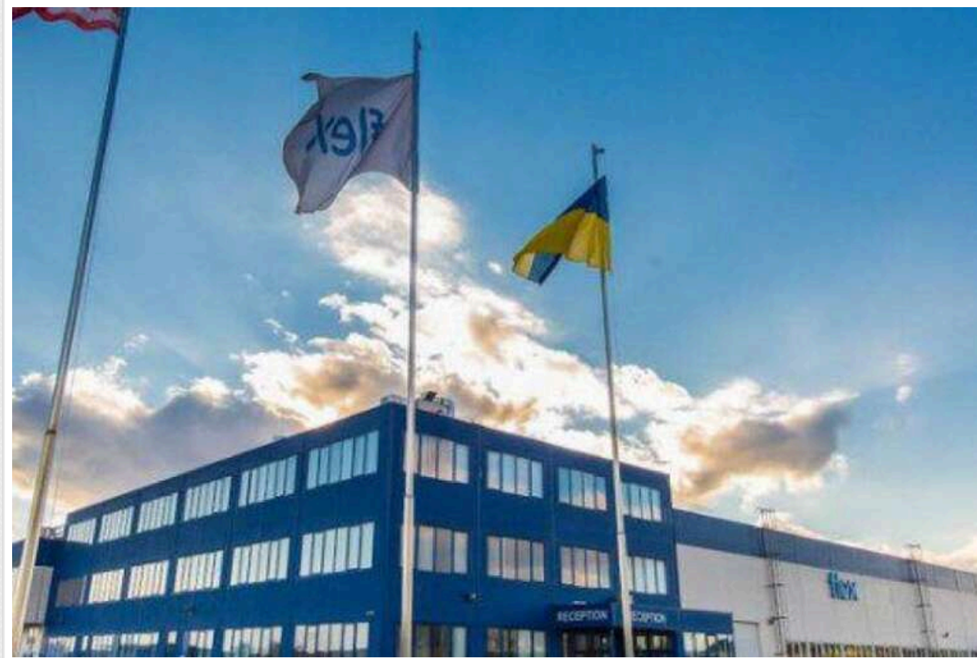
Підприємство, яке належить американській компанії, відправило працівників додому через інформацію про ракетні обстріли

Про це повідомив журналіст Віталій Глагола.