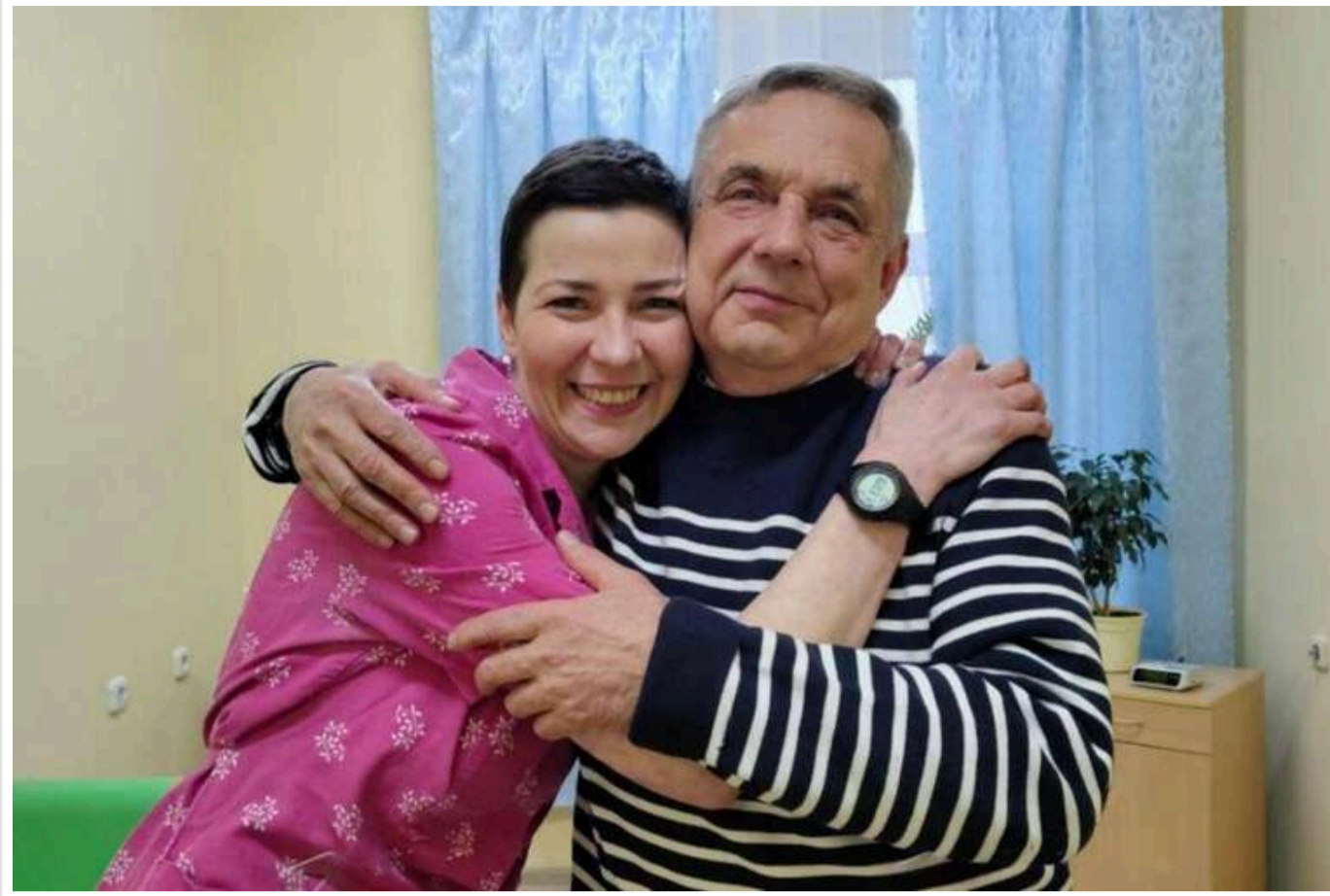
Лукашенко звільнив 32 політичних в'язнів

Як повідомляє пресслужба самопроголошеного президента РБ Лукашенка, серед помилуваних засуджених за "екстремістські злочини" знаходяться 8 жінок і 24 чоловіки.