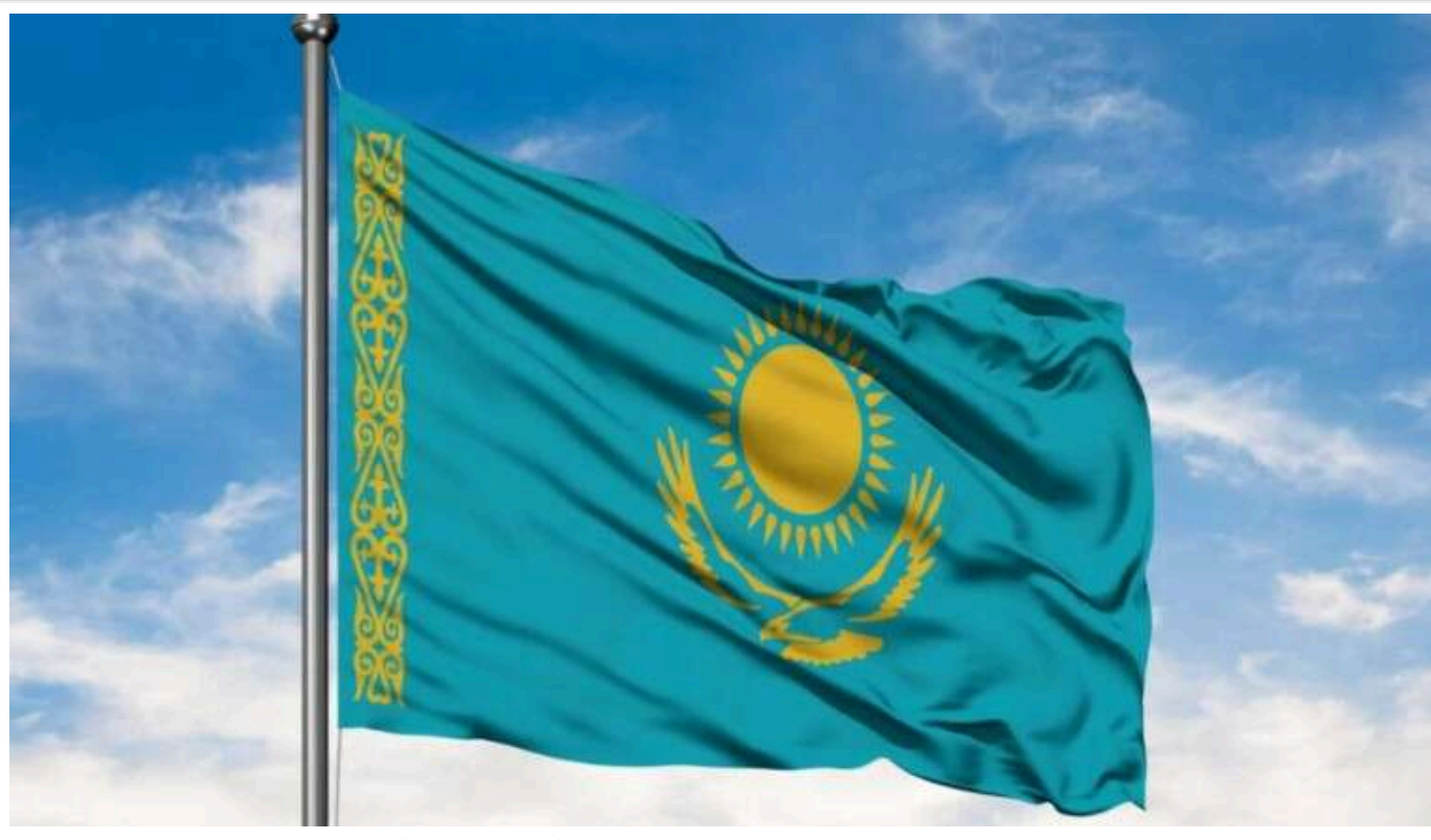
Посольство Казахстану звернулося до своїх громадян із закликом залишити Україну

Посольство Казахстану в Україні звернулося до своїх громадян з проханням покинути країну.