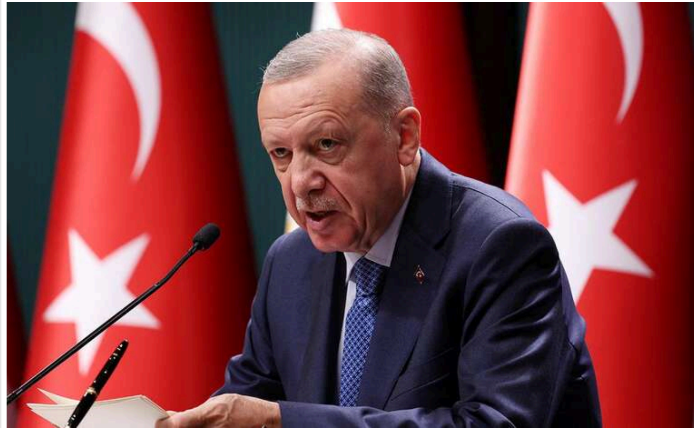
Президент Туреччини розкритикував Байдена за дозвіл на удари АТАСМС по Росії

Рішення президента США Джо Байдена про дозвіл для України на удари далекобійними ракетами АТАСМС по об'єктах у глибині країни-агресора Росії у Туреччині вважають помилковим.