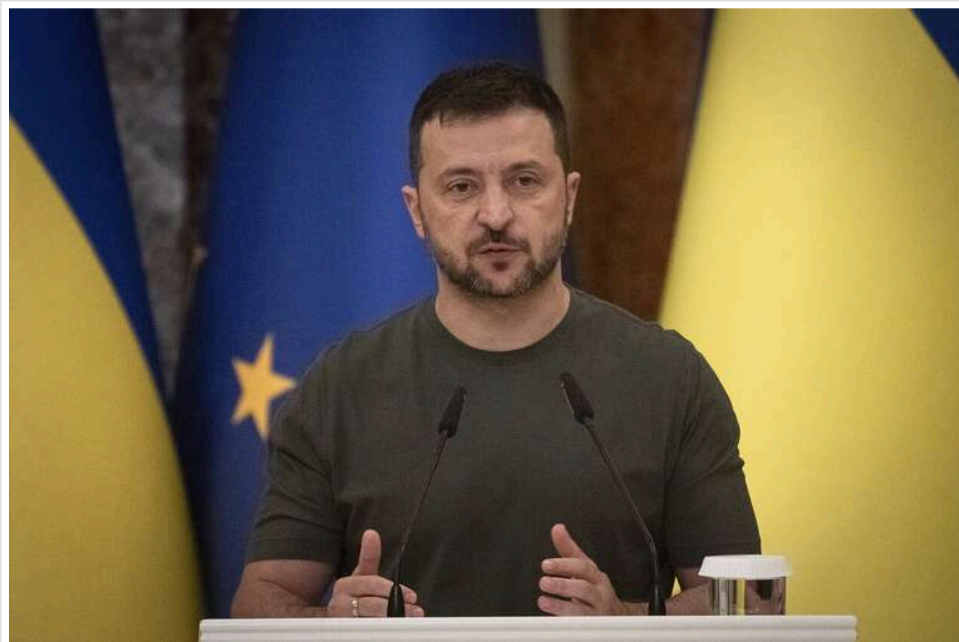
За 1000 днів Росія витратила понад 17 мільярдів доларів на авіаудари по Україні, – ЗМІ

Загалом було випущено понад 10 000 ракет і понад 13 000 БпЛА.