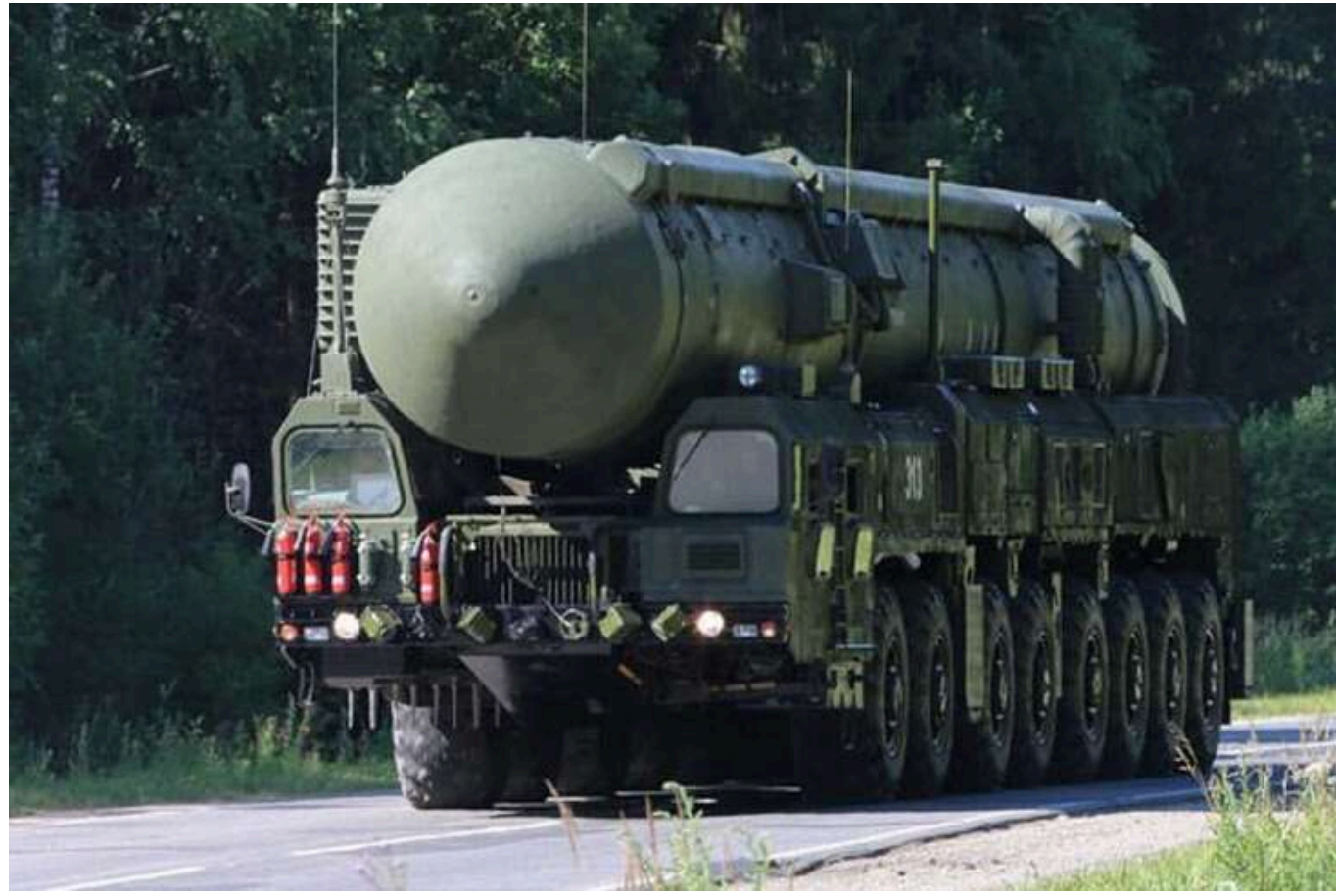
Ракета «Рубіж» долетить до Києва за 8-10 хвилин – її неможливо перехопити, – військовий експерт