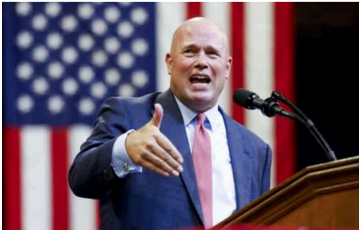
Трамп призначив кандидата на посаду посла США при НАТО

Обраний президент Сполучених Штатів Америки Дональд Трамп висунув юриста Метью Вітакера на посаду посла США при НАТО.