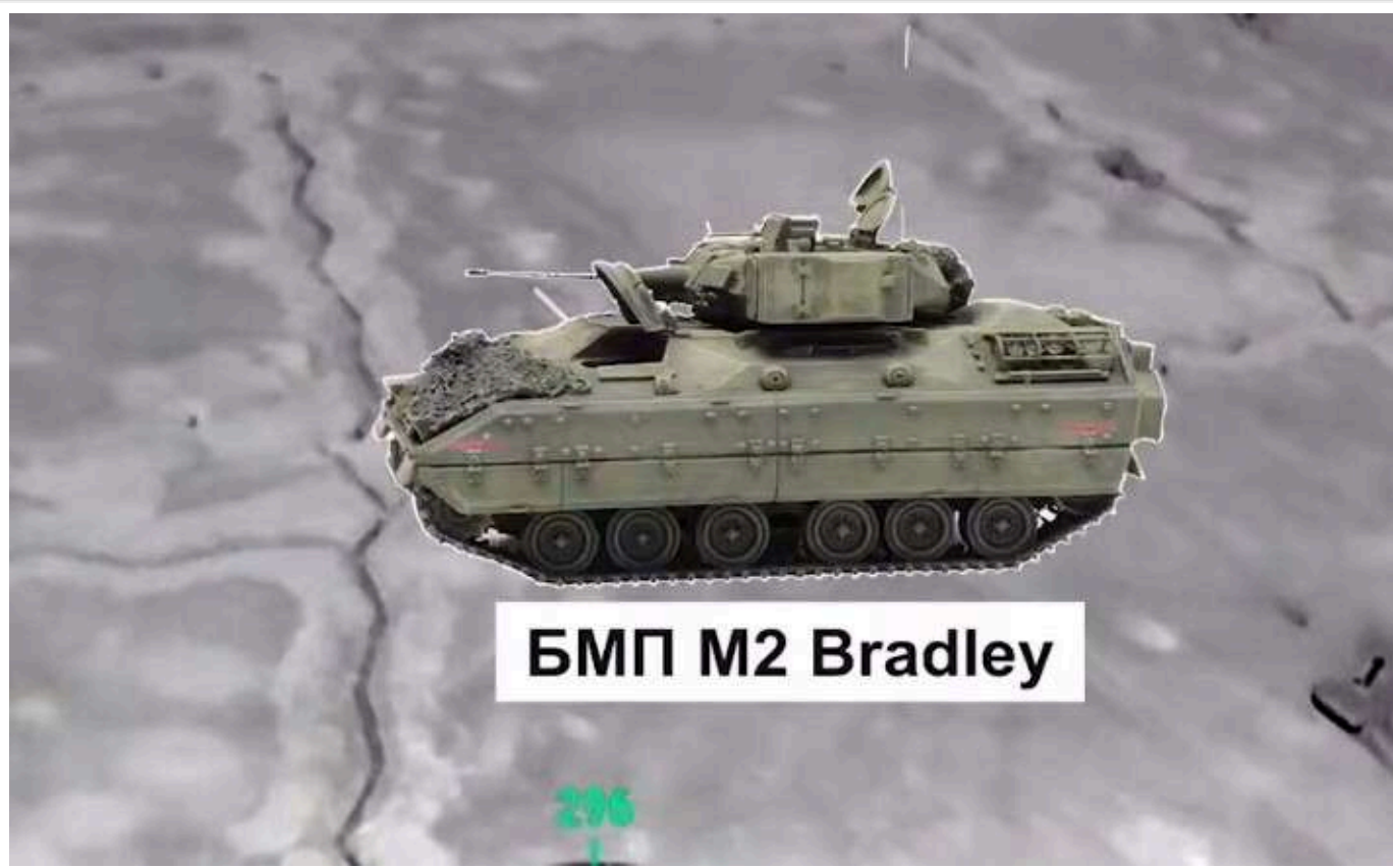
БМП M2 Bradley

ЗСУ на Покровському напрямку влаштували "шоу" перед окупантами та захопили їхні позиції