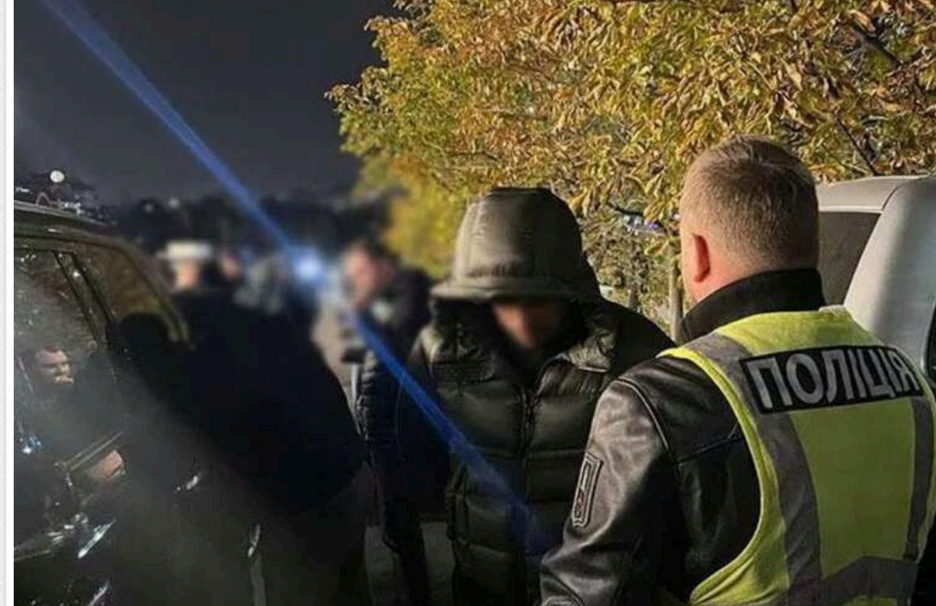
У Києві затримали двох зловмисників, які обіцяли чоловікам-ухилянтам "роботу" в друкарні та відрядження за кордон

Співробітники СБУ та Нацполіції затримали у Києві двох осіб, яких, за інформацією слідства, підозрюють в організації схеми ухилення від мобілізації. За 58 тисяч доларів США вони обіцяли двом призванним "працевлаштування" в друкарні з можливістю відрядження за кордон.