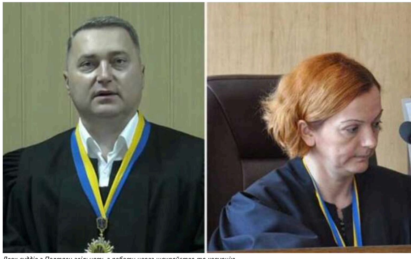
Двох суддів з Полтави звільнять з роботи через шахрайство та корупцію

Судді розглядали справу, в якій один з них отримав хабар за рішенням.