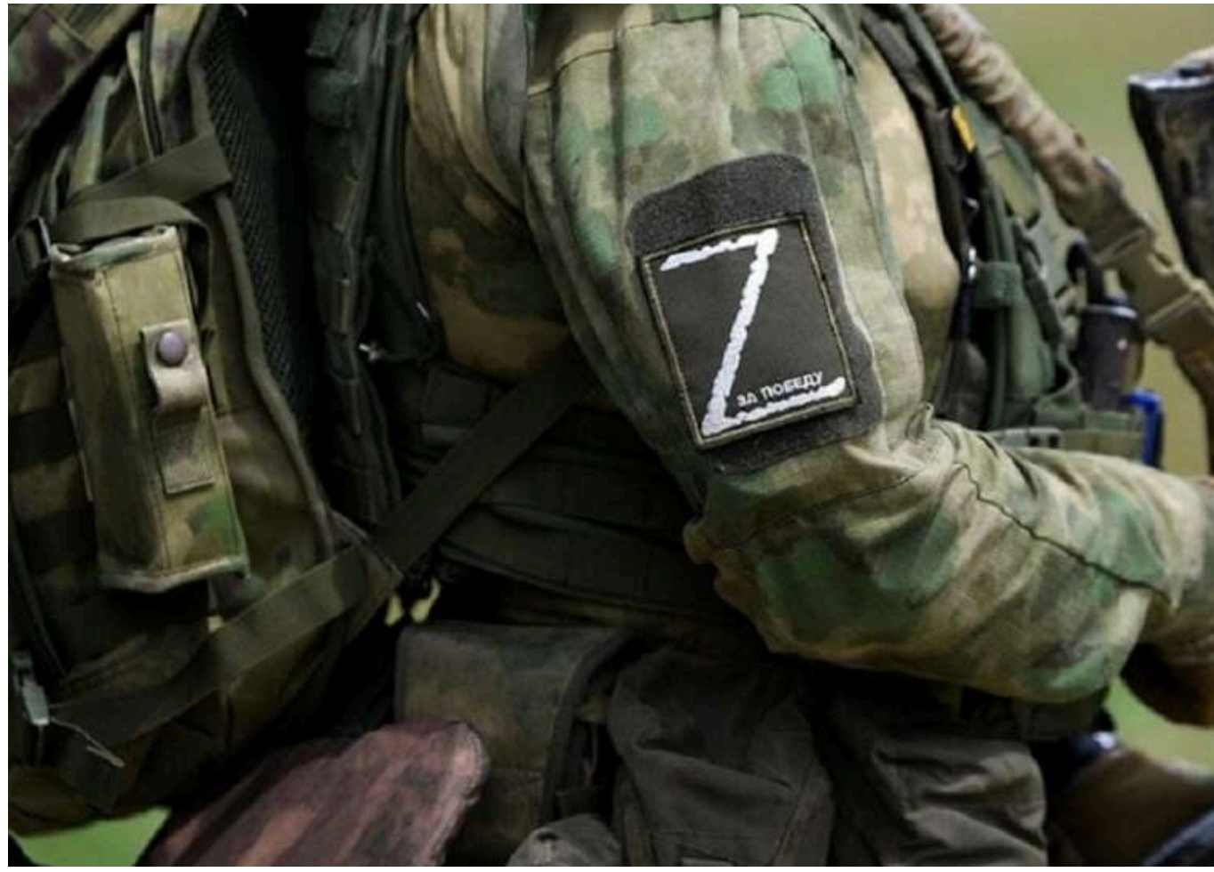
Російські окупанти скоїли черговий злочин: розстріляли українських полонених