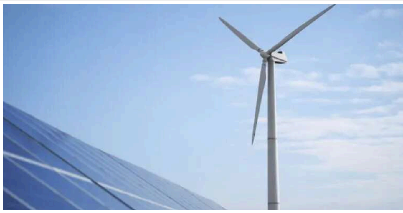
ЗМІ: Україна створила "зелені" енергетичні мережі, які РФ важче зруйнувати

Сонячні та вітряні електростанції децентралізовані, тому одне влучне попадання завдасть їм менше шкоди, ніж удар по ТЕЦ.