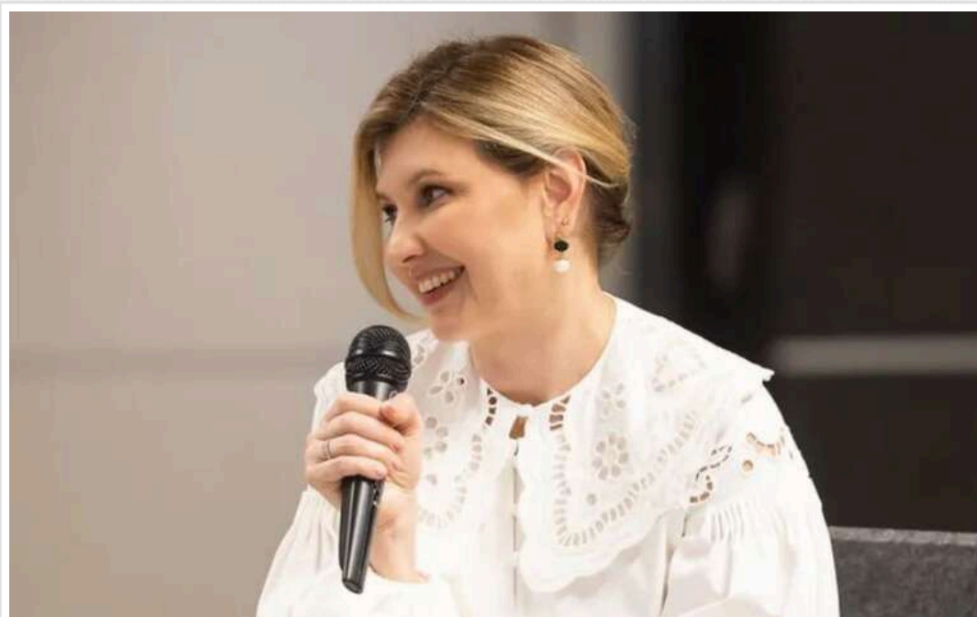
Зеленська вбралася в оригінальну мереживну вишиванку під час візиту до Словенії

Під час офіційного візиту до столиці Словенії – Любляни перша леді України Олена Зеленська одягнула оригінальну мереживну вишиванку. У елегантному образі вона відвідала суботню школу "Рукавичка", де зараз працюють та навчаються вимушені переселенці з України.