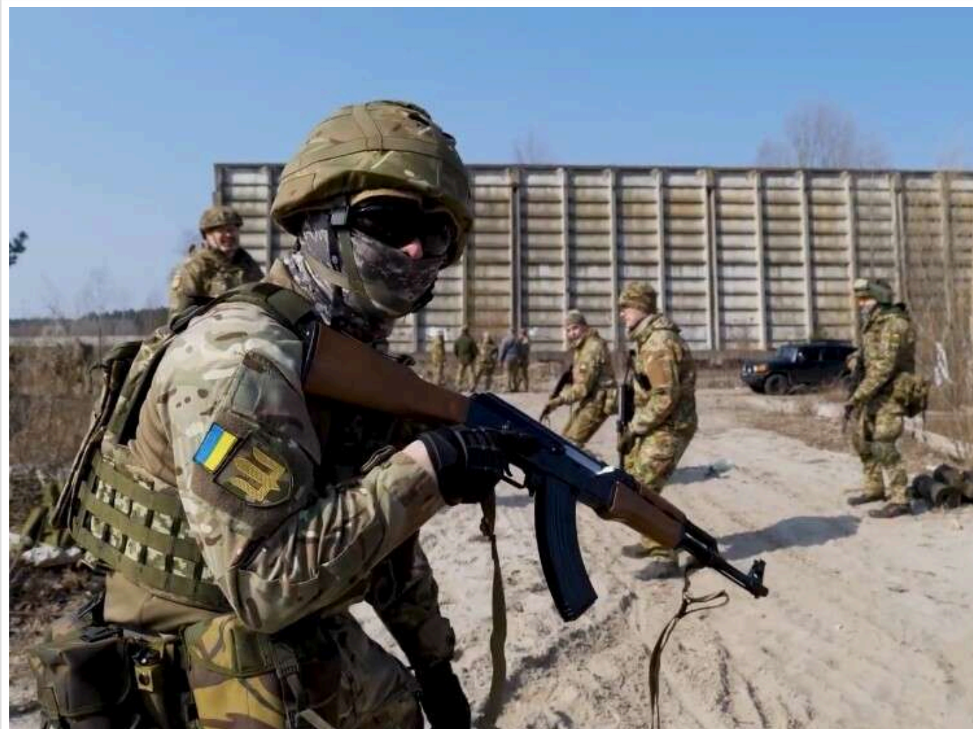
В ISW пояснили, що дасть Україні дозвіл на далекобійні удари по Росії

Дозвіл на далекобійні удари по Росії може мати вирішальне значення для спроможності Росії продовжувати військові дії. Це дозволить послабити російський військовий потенціал на всьому театрі бойових дій.