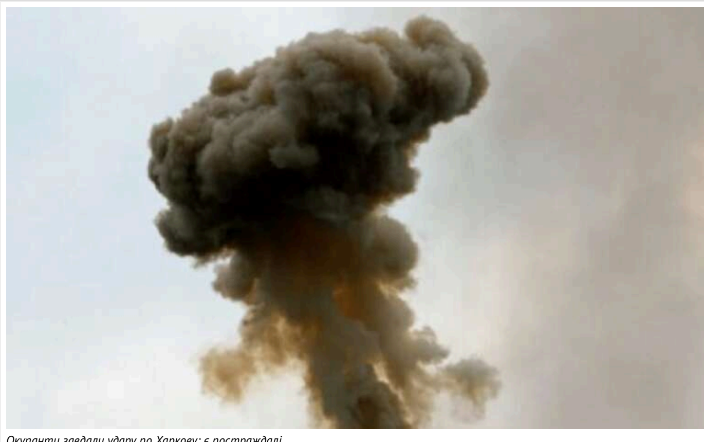
Окупанти завдали удару по Харкову: є постраждалі

Російські окупанти вкотре завдавали удару по Харкову. У Київському районі було зафіксовано влучання.