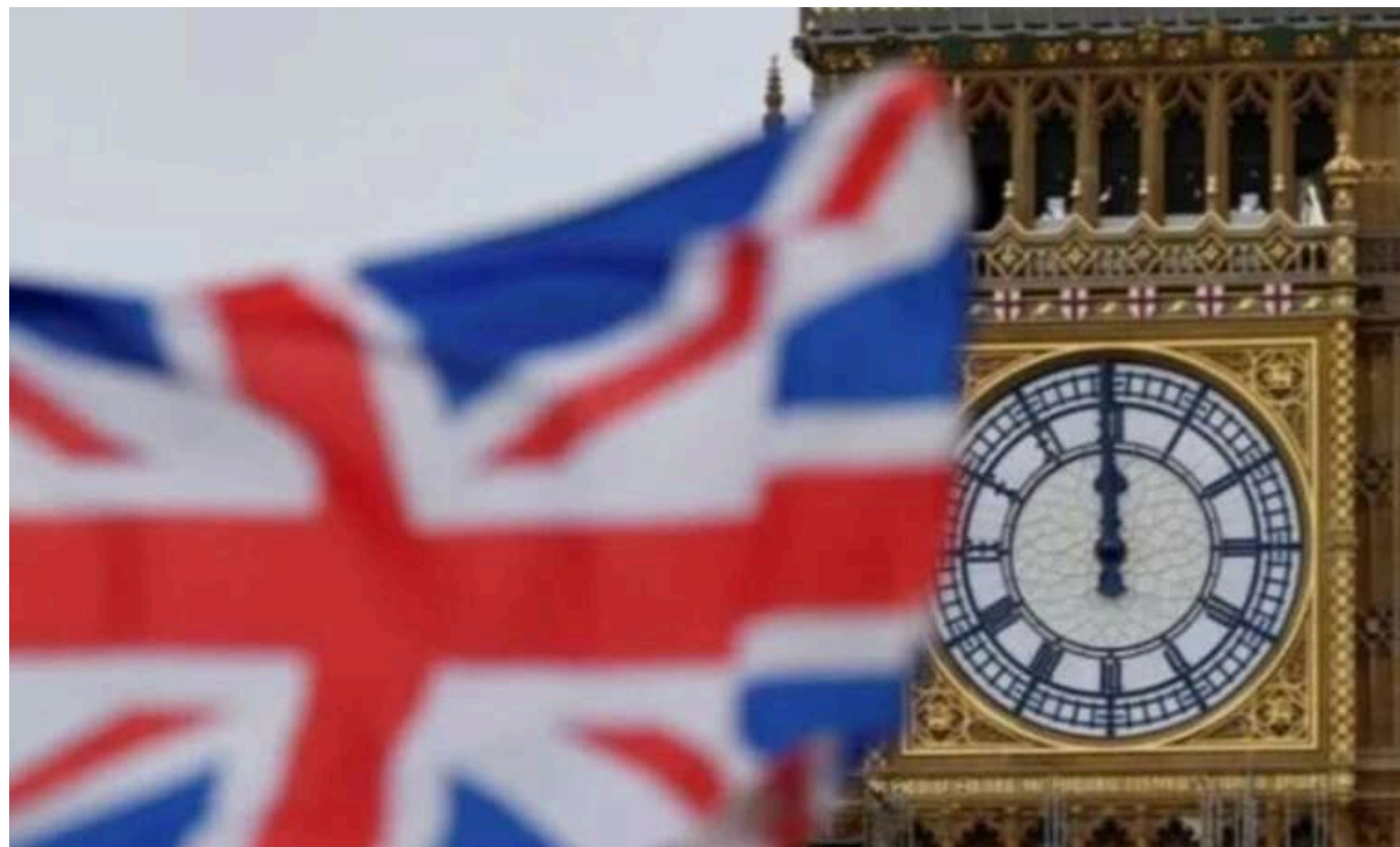
Британія повідомила про нові санкції проти осіб, причетних до перевезення українських дітей до Росії

Британія оголосила про санкції проти низки осіб, які мають відношення до примусового вивезення Росією та "перевиховання" українських дітей із захоплених територій.