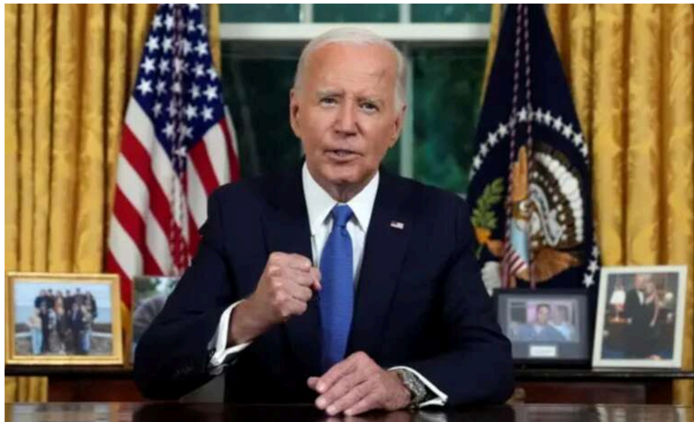
Байден дав дозвіл на використання далекобійної зброї проти Росії

Помічник державного секретаря США Браян Ніколс підтвердив дозвіл Байдена на використання далекобійних ракет проти Росії.