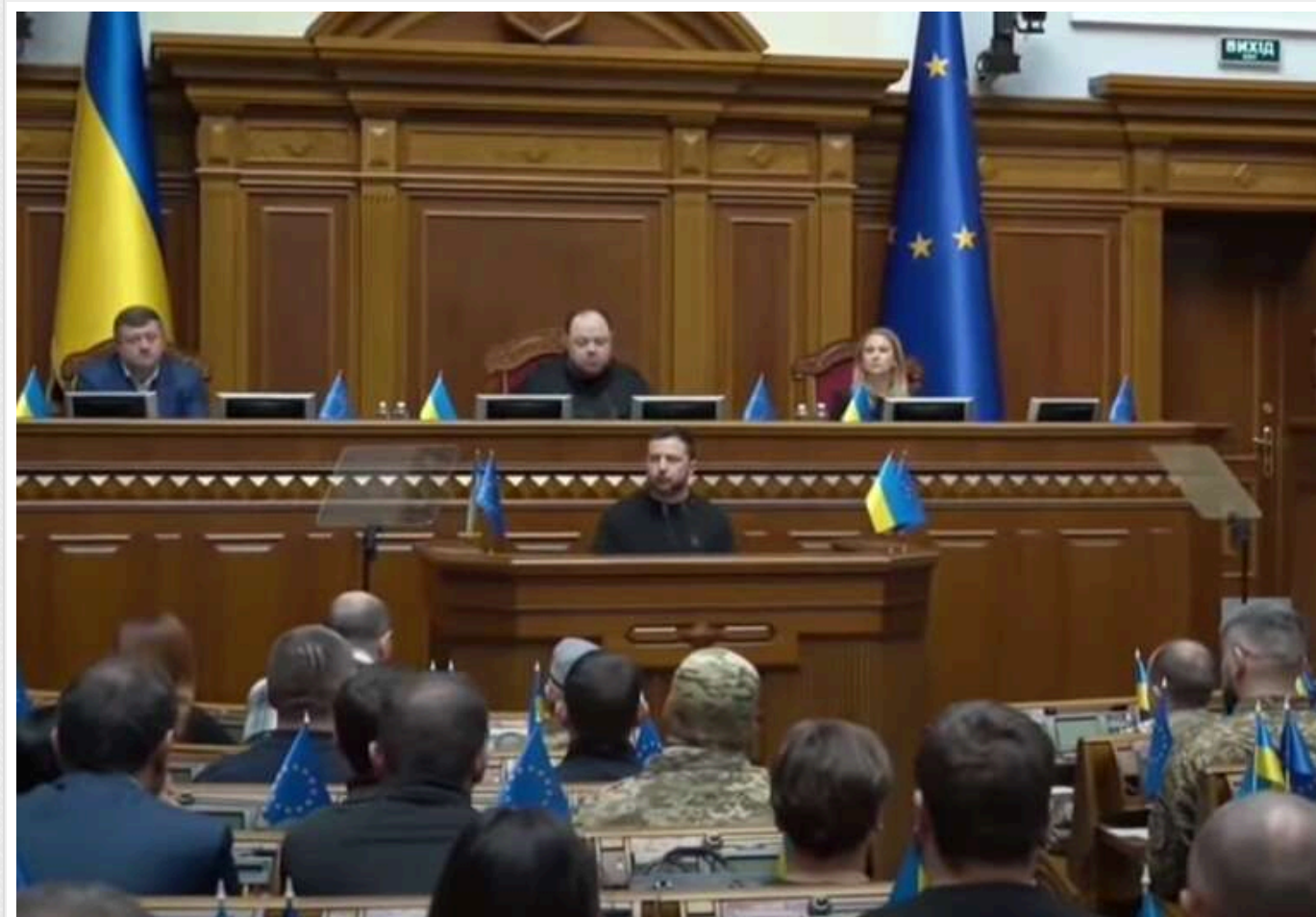
Президент Зеленський виступив у Верховній Раді та заявив про "План стійкості"