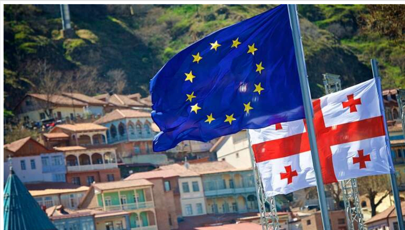
Євросоюз скасував виділення 121 мільйона євро уряду Грузії

Євросоюз має намір перенаправити ці кошти на інші цілі, повідомив верховний представник ЄС із закордонних справ і політики безпеки Жозеп Боррель.