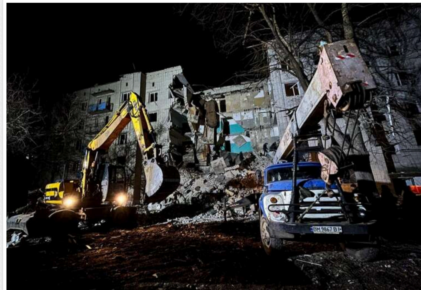
Внаслідок удару по гуртожитку в Глухові число загиблих досягло 10 осіб, а поранених - 13