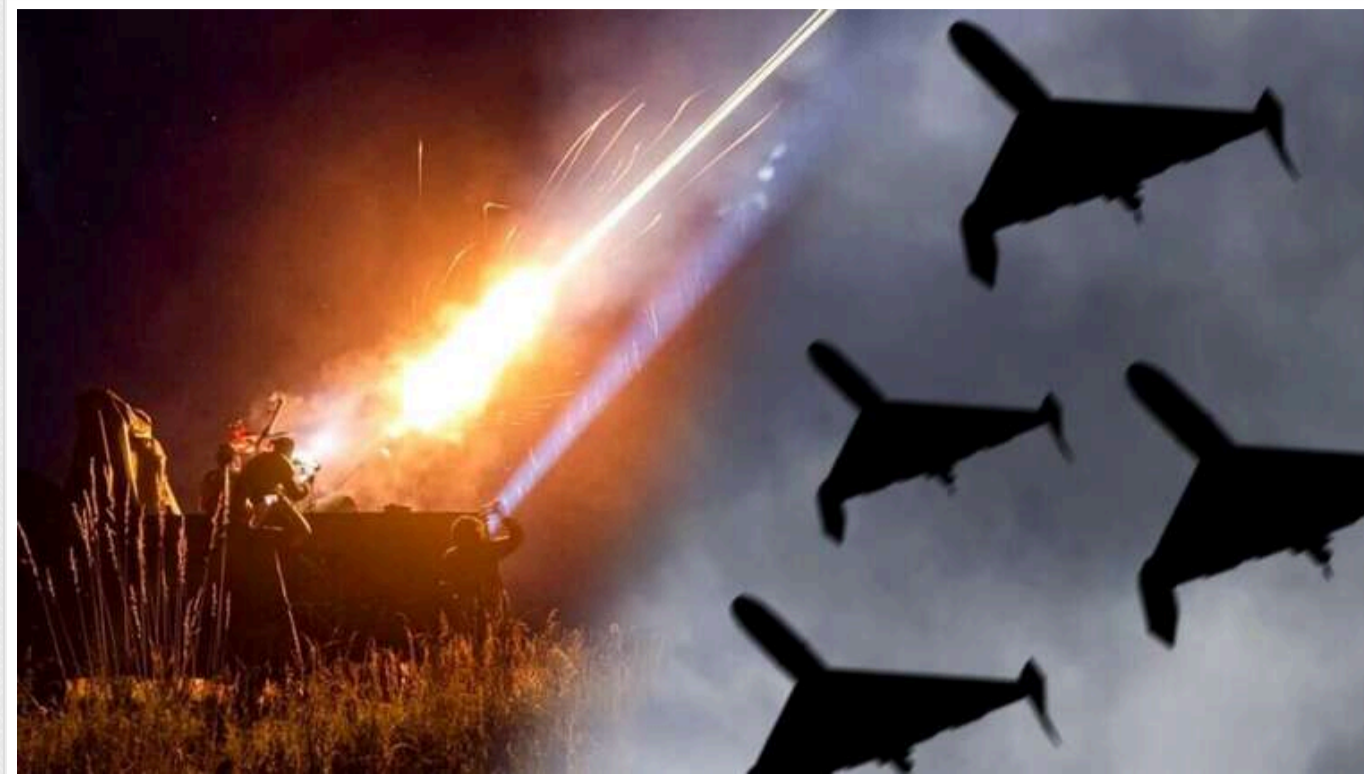
Окупанти атакували Україну 90 "шахедами": є руйнування та жертви

У Запоріжжі через ворожу атаку без електропостачання залишилися понад 17 тисяч громадян. У Сумській області дрон "Шахед" влучив у гуртожиток, внаслідок чого несумісних із життям травм зазнали семеро цивільних.