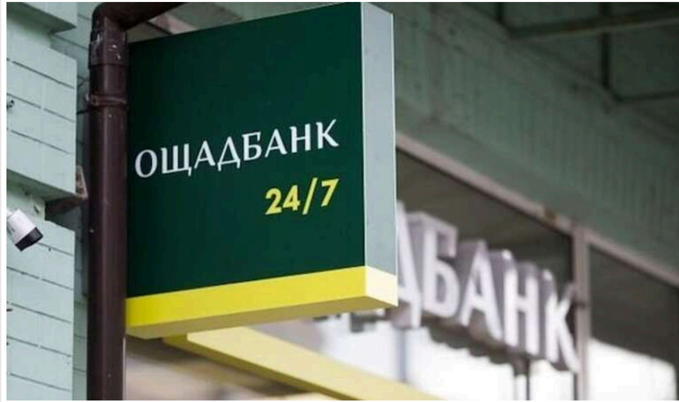
«Ощадбанк» планує витрати на саморекламу в сумі 6,5 мільйона гривень

Державний «Ощадбанк» оголосив тендер на закупівлю рекламних послуг вартістю 6 500 000 грн, про що повідомляється на порталі „Прозорро“.