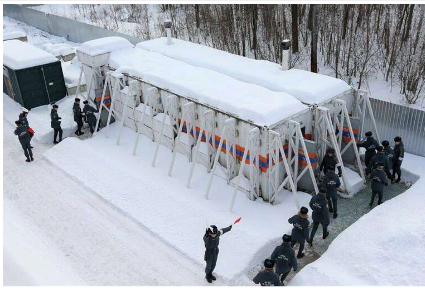
Росіяни запустили серійне виробництво мобільних сховищ від ядерного вибуху, – росЗМІ

У Росії почалося серійне виробництво мобільного укриття на випадок ядерного вибуху.