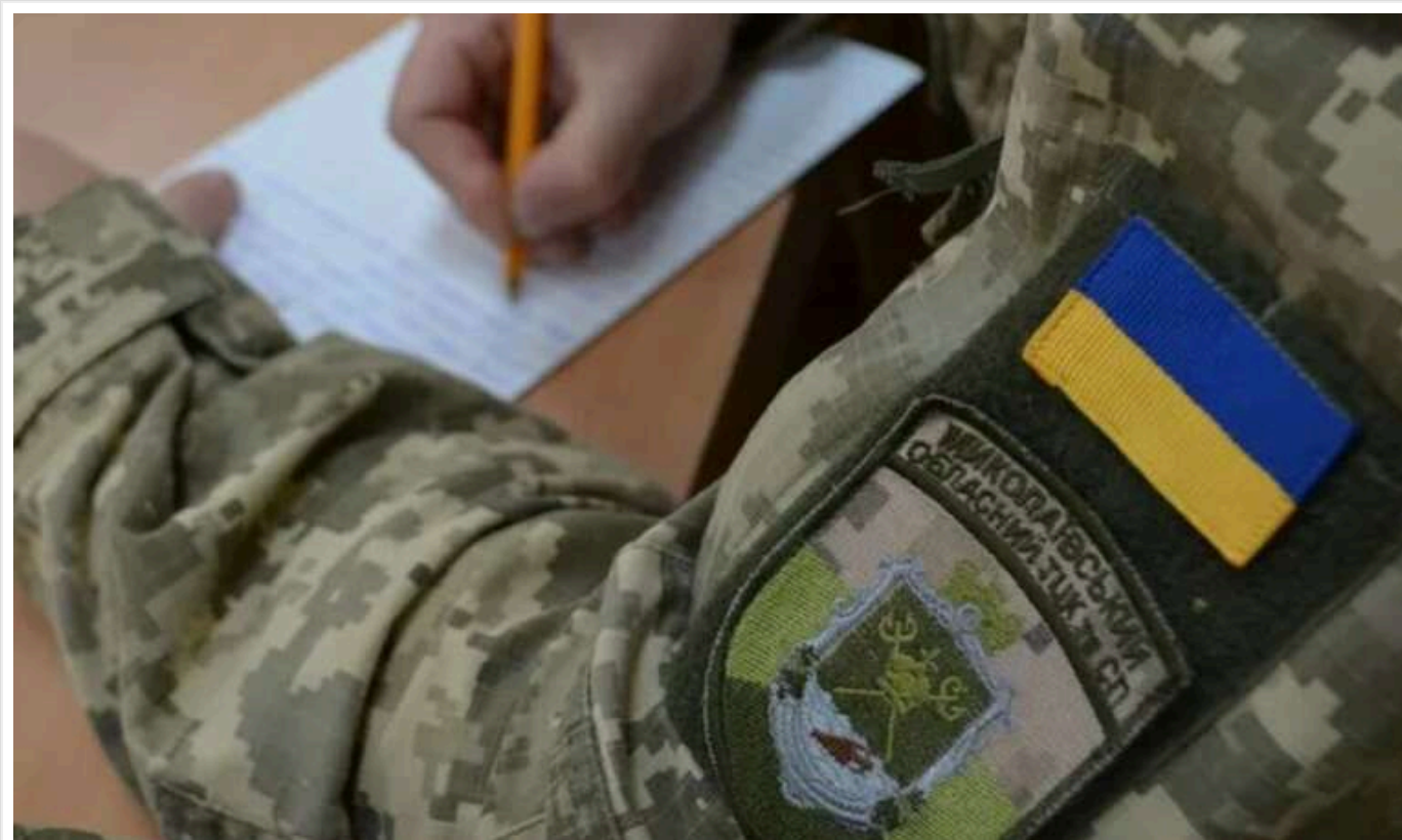
У разі несплати штрафу від ТЦК сума може подвоїтись через 15 днів, – адвокатка