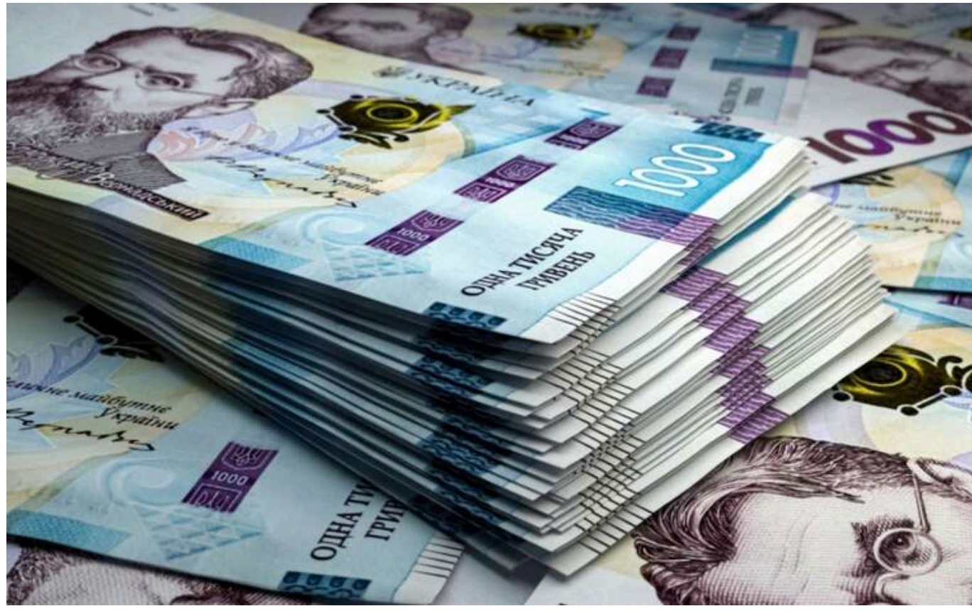
Міста України через скасування реверсної дотації можуть втратити до 13 мільярдів гривень